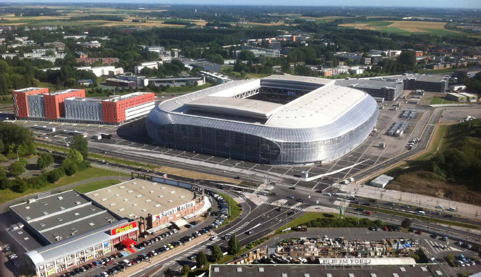
Lo Stadio nel paesaggio suburbano di Villeneuve-d'Ascq