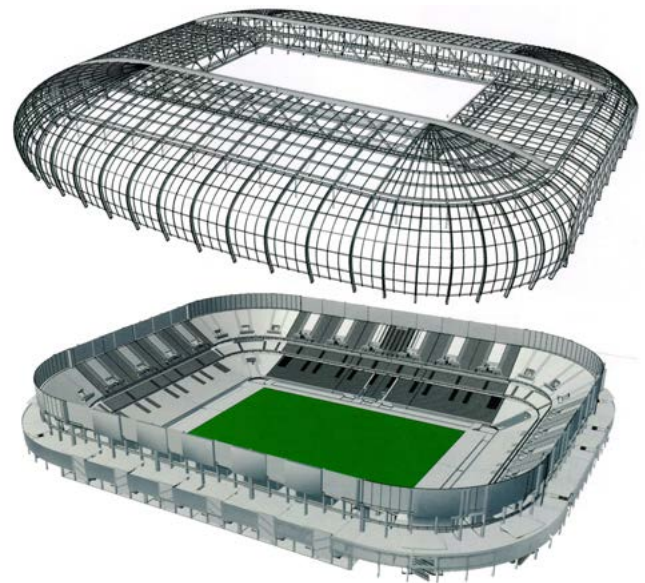
Esplso dello stadio: il campo di gioco, le tribune e il sistema strutturale