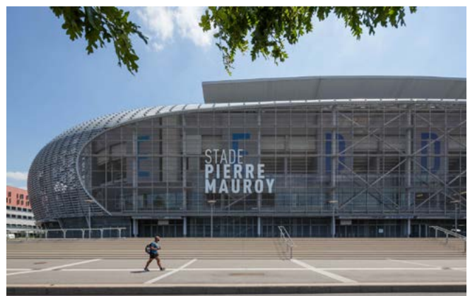
La facciata principale in rete metallica funge da supporto per la comunicazione