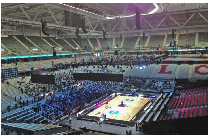
Gli incontri per il Campionato europeo maschile di pallacanestro 2015

richiesto di avanzare proposte che testimoniassero la rinascita della città, si ponessero come nuova centralità urbana, declinassero caratteri innovativi e, infine, offrissero la possibilità di accogliere sia manifestazioni sportive che eventi culturali. 3