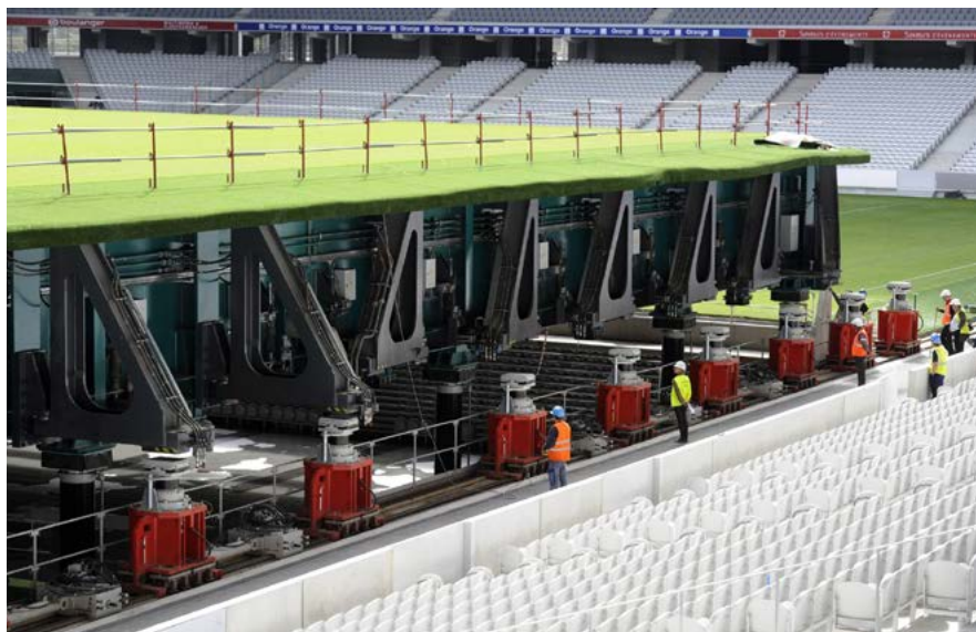
Il sistema di martinetti idraulici che consente di sollevare metà del campo di gioco