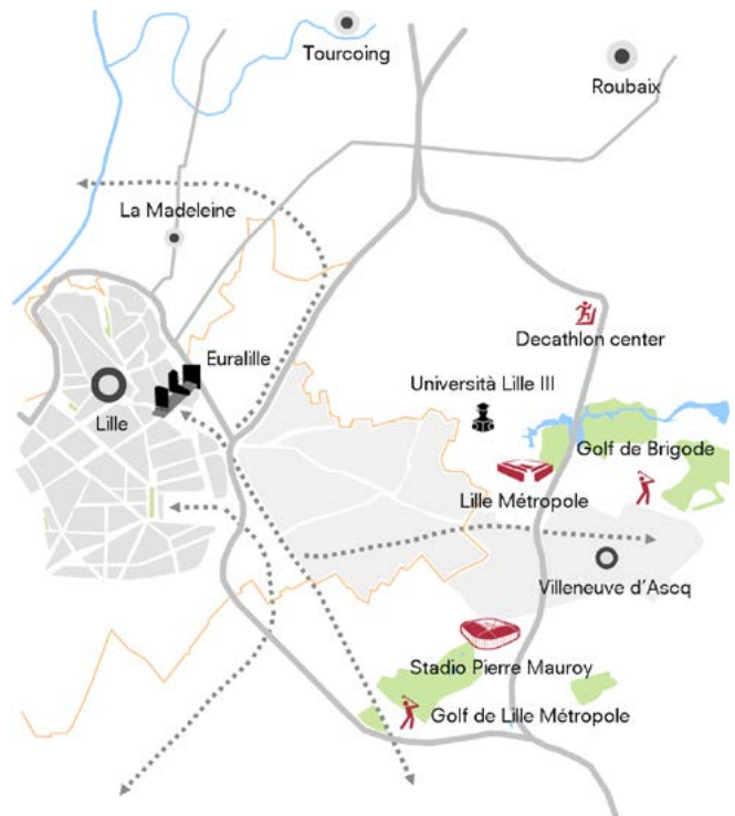
Inquadramento territoriale della Città di Lille